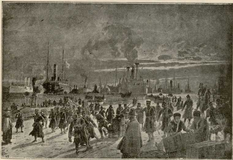
აზნის ფლოტის ჯარის გადმოსვლა ჩემულებში.