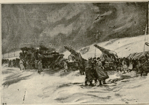
მანკურაის გზაზე.—არტლერის გალაზია.

ლება აქვს ბელიკოს დედაკითანი, ან როგორა სწყვეტავს ამ არსებობის საკითხს, არავის არ გვიანტრესებდა. იქნება ეს აზრადაც არ მოგვიდოდა იმისათვის, რომ იმკაცს, რომელიც ყოველ-ნაირ დარში კალოშებით დადის და ძილის დროს სძიან-ში იმალება, გვეგანა, რომ სიყვარული არ შეუძლიანო. „ბელიკოვი უკვე ორმოც წელს გადაკიდებულია და ვარინკაც ოცდაათის წლისაა, — განაგრძო დირექტორის ცოლმა: — მე მგონია, ვარინკა გაჰყვება ბელიკოს.“ რამდენი არა საქირო და ცრული რამ ხდება მოწყენილობის გამო ამ ჩვენს პრეფიციაში! ეს იმიტომ, რომ არ აკეთებენ იმას, რაც საქიროა. აი, თუნდა მზინაკ: ისე უცხად საიდან მოგვინდა ბელიკოვის დაქორწინება, რომლის წარმოდგენაც კი ძნელი იყო. დირექტორის ცოლმა აიღო ლოჯის ბილეთი და ვხედავთ, რომ ვარინკა და ბატარა შენარტული ბელიკოვიც, თითქმის მარწყულით გამოუთრევიათ ხახლიდანაო, იქ არიან. მე ემართავედი საღამოს და ქალები თბოლობდნენ, რომ უთუოდ ბელიკოსა და ვარინკასაც დაღუბებო. ერთი სიტყვით, დიწყო მანქანამ შემშობა. შემ-