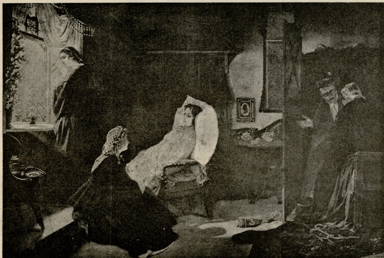
უკანსეული გაზაფხული. სურათი ბარონ კლოდის.