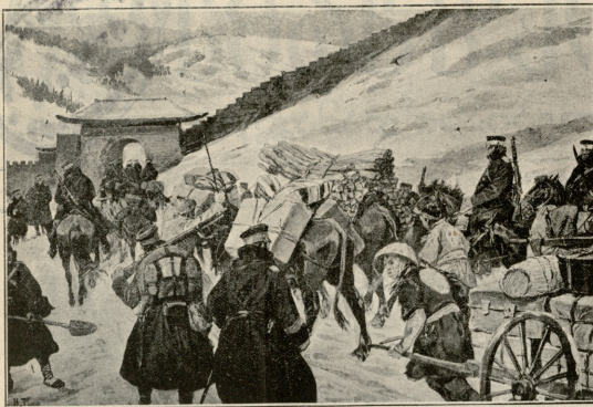
ამონაკლები კორეაში.—სურათის გალაზია.