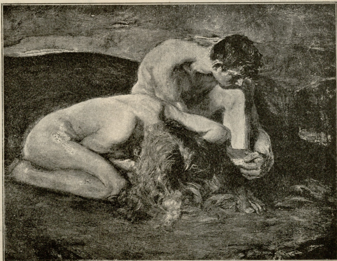
დაგარგული სამთხე.—სურათი ჰულ რატის.

ლი პირისხე და კარგი ტანსამოსი. რაც შეეხება ქალებს, ჭნულარ იტყვით იგივე ერთხელე და ყველასგან შესწავლილი უწო, დათნითლი - დაკუქვილი არსებანი, რომელთაც მიელი სხელი ჩვიარიე მოშეგებული აქეთ და სულელურ სხეზე მალ დატანებული გულგრილობა ეხატებო. ამ ქალებს ვთვლიერებდი და ვფიქრობდი: არც ერთი ამ გახრწილ არსებათაგანი, არც ერთი ამ ქაობის ფრინველის ვებნინანი, მღვდლის მუტლიანი, გასუქებული და დამშატებული ქალთაგანი ღირსი არ არის იმ ერთის ლუიღორისა, რომელსაც იღებენ, თუმცა კი ყოველთვის ხუთს თხოულირებენ ხოლმე. მაგრამ უცებ ყურადღება მივაქციე ერთს პატარა და კარგ ქალს, რომელსაც თუმცა არც თუ ისე ახალგაზრდა სახის გამომეტყველება ჰქონდა, მაგრამ დაუთენთავი, მკერცელი და კოპწია კი იყო. ეს ქალი მოუფიქრებლად, უცებ გავაჩერე და როგორაც სულელურად ლაპარაკი დავუწყე. შინ დამრუნებესა და სრულს მარტობის ისე საზოგადოება და დიქმულ ქალის გულში ჩახუტევა ვარჩიე. უკან გავეყვი. ის სტეოგრობდა Des Martyrs-ის ჭეზზე, უშველებელ საზღში. კბეზე საწთელი ჩაქრობილი იყო. ნულ-ნელა ავიღო, ყოველ ნაბიჯის შემდეგ ებორძიკობდი, ყოველ წამს წუმწუმს ვანთებდი და ჩემ წინ მოპრიალე კაბას მივდედი.