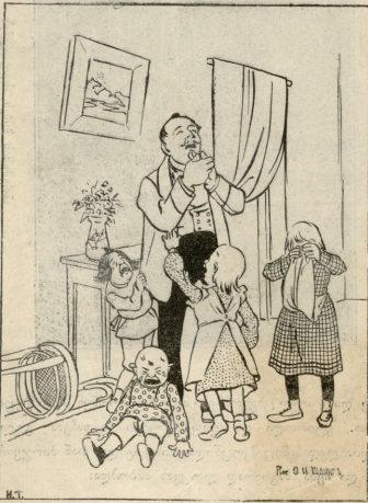
მამის ანაბარ დატოკებული ბავშვები.