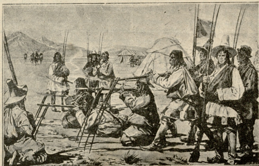
ტაბუტა.—ტაბუტელმა ბრძოლის ველზე

როგორც იყო ისევ ნინომ დამაშოშინა. ხინკაღმა ხო