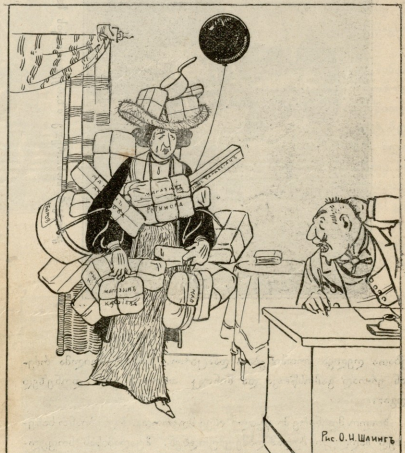
მღაზიიდან დაბრუნებული დეა:— კიდევ მომეტი უფლი, დამკვდა.