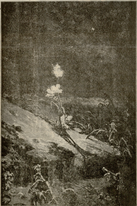
საქმეა შუქი. სურათი კოტარბანისკის