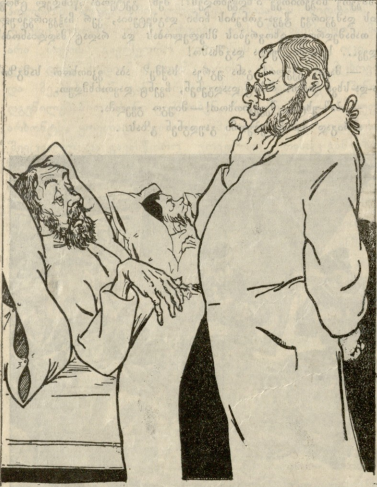
— ექიმო, თუ სიკვდილი მიწერია, კარგი ექმნება გამკრა. — რა საქრონი? — გაუკვებ მახინ რითი მოეკვლები!