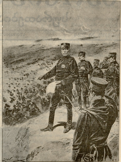
იაშონის ბარეულ არმიის მთავარ-სარდალ გენერალი გურგაძის პრინციპის ველზე.

ძლიან მსხვერპლი მითუნაო ატტიკას და დავიქიო აკრო-პოლისში ალაჯი ჩემის უმაღლეს წინაპრის კოდრასი. ეგბატრიდიელთაგან ეინ გაუხბდება ამას წინააღმდეგე; მაგრამ არა მსურს გაეიშეორო კოლონის ისტორია. იცი, ყოველ დღე მოდიან ჩემთან ბარისა და მთის მცხოვრებნი და მეკითხებიან, განა არ შეიძლება შესუსტო შენი დაღვნილებანიო. ისინი ფიქრობენ, რომ მე, როგორც უფროსს არხონტს, ყოვლად ძლიერს, შემძლიან სურვილებისამებრ შევცვალო და გავასწორო ყოველივე, რასაც განვიზახავ. ნუ თუ ზენელოპასავით უნდა მოვიქცე და დღისით გაკეთებულს დამე მოულო პოლო? მოდიან სხვებიც, განსაკუთრებით წერელი ხელოსნები, რომელთაც სურთ გავიგონ სხვა და სხვა დაღვნილების მიზეზი. მაგრამ უახლო და თითქმის საზიანო შრომა იქნებოდა, ყველასთვის ცალკე განუმარტან ის, რაც გამოწვეულია სახელმწიფოს ინტერესით. ჩემ კანონში ბეგრის სიმდიერეა და ხანდახან ხალხი მებრალემა კიდევ, რადგან იძულებული ვარ ტანჯვა მივიყენო. მოხარული ვიქნებოდი თუ დამეგებებოდა არხონტს თანამდებობისთვის. მაშინაც ხომ ყოველ გავირგებულ შემთხვევაში მევე მომბართავდნენ, იმიტომ რომ მე ერთად ერთი კაცი ვარ ატრიკოში, რომელსაც ყველა ენდობა. ერთი ისტყვით, შეიძლება დადგეს ისეთი წუთი, როდესაც თვითონ შევეტან ექვს ჩემ კანონებში. მე—კაცი ვარ, პიონი, და მეშინიან ჩემის სისუსტისა.