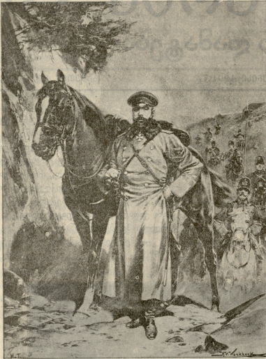
რუსეთის ვარის მთავარ-სარდალ გენერალი გურგაძის პრინციპის ველზე.