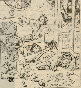
არეის მიხეზით დარღვეული იუჯისი მუღრლიობა.