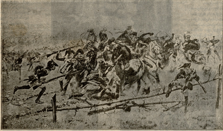
წასვლადან.—ბრძოლა დროშისთვის.—სურათი კორსიკის.