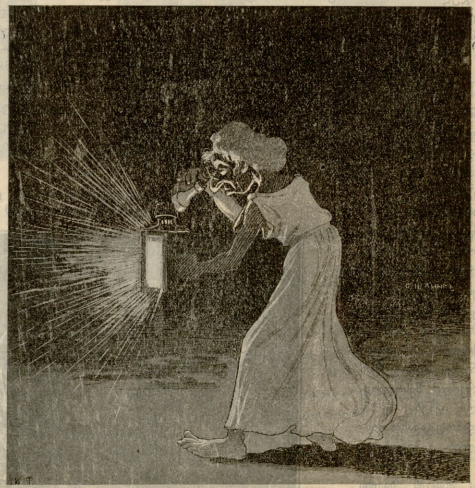
— ვეგბე, ვეგბე „ოაგს“, რომ ჰქონდეს თევი, მაგრამ!..