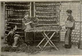
ჭლის შარკის კარგეხვა.