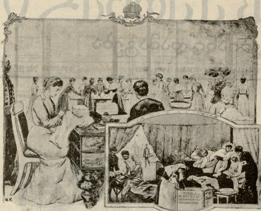
ხელშეიფე-დელოვალი ალექსანდრა თოფაიუს ასული სვდეგუს ჭკურეს დაჭრადა და ზღაფთოფე მომართის.