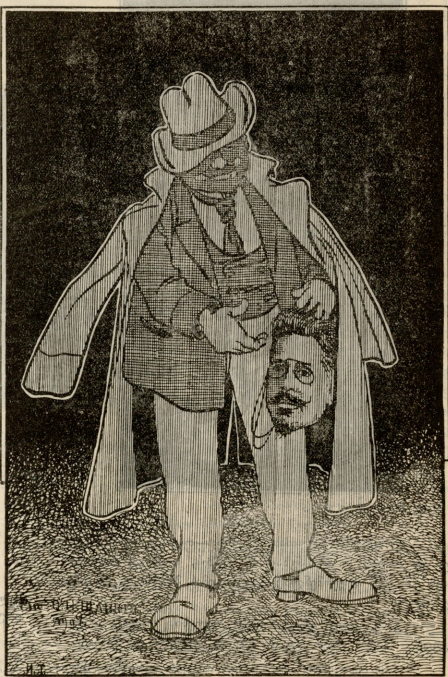
როგორ მოქონთ, ვერ არის სა-ათვოთ თავი?!