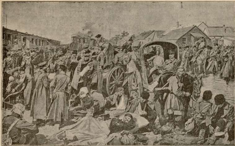
ტურქმენთან დაჭრაღ მკომართა შეკანება მუყანა რანის ცხათა.

შენ გგონია, წვეთ-წვეთად რომ სწევთს მწვანე ფოთლებიდან, ეს დილის ცვიარია? ეს სისაბრუნის ცრემლებია! ხედავ ბაღახ-ფოთოლ-ყვავილთა ნახ რხევას?... გესმის შაშვე-ბულბულის ვაღობა?... ლმერთო! — წარმოსთქვა ფასომ რაღაც ნეტარებით, თითქმის ხმა მაღლა, „ყურიფული ხარობს, ყურიფული ბენფერია, ვაღობს, ქიკიკიოსს... ნეტაი თქვენ, ჩიტებო, ყვავილებო, ბაღახო...“ ის ერთბაშად მოულოდნელად შეკრთა, ვაიმართა წელში, მიეყრდნო სვეტს და ერთ წუთს იყო რაღაც გამოურკვეველის გამომეტყველებით, მღუმარედ: შემდეგ სახე როგორღაც გაუნათლდა, თვალები გაუბრწყინდა და ტუბები აუთამაშდა უანგარიშო სისარულის, სიყვარულის და ბენფერის ღიმილით. აღუღებულმა ნახის მოძრაობით ფრთხილად წაივლო ორივე გამბდარი ხელი მუცლებზე და, ისევე ისეთის სიყვარულით ვადიმებულ ტუბებით, თრთოლით წარმოსთქვა. „თიამაშე, შელო, თიამაშე, — შენ გენაცვალის დღაშენი. ღმერთი მოპასურობს შენს...“ მან აღარ დაათვა თავისი აზრი: იმის სიყვარულით აღსავსე გულს მოსწყურდა თანამგრძნობი, საყვარელი თანამაზრე, მოაგონდა ქმარი, მაგრამ იმ წამსვე წარმოუდგა ქმარის ცივი, პირქუში სახე, დამკინავი თვალები, რომლებიც ცივად, შწარ გრძობად დასცა გულზე; ერთ წუთს შესდგა ბენფერების სურვილით ვატატებულმა, ვააქნა თავი, თითქმის მოიშორა უსიამოვნო წარმოდგენა და ისევე გახედა ბუნებას: იქ, ეზოში, ღობესთან, ხშირ, მაღალ ბაღახებში, ბაღის გასწვრივ ყვავდა ვარდის დიდი ბუჩქი. ფასომ მსწრაფად იიწია კალთა და ჩქარის მხიარულის ნაბიჯით გასწია ვარდის მოსაკრეფად.