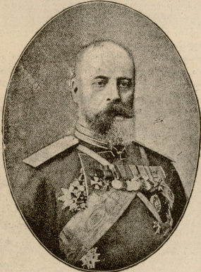
გენერალ-ლეიტენანტი გრაფი გელაქია. ვაფანგოუს ბრძოლაში მიიღო მონაწილეობა.

— კი ბატონო, რა: შენისანა სასახელო კაცს დავბაიჯებ, აბა რა...— მიუგო ყარამანმა სარიდანს და მიუბრუნდა თე-მურასს:— რას იზამ, თემურაზ? იმ სამ დღეს, ხუჩაფათიდან