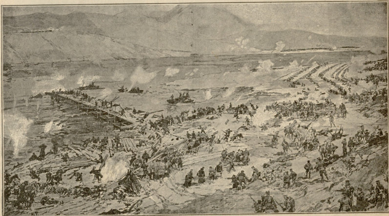
ბირგელი ბრძოლა შორეულ აღმოსავლეთში ათლზე კავასელის დროს.

გარიგრავდა. მზემ უხვის სხივებით გააშუქა და გააღვიძა ქვეყნიერობა: ყველაფერი ახმაურდა, აქიკტიკდა, აშრიალდა. ყველა სულიერი და უსული თითქოს სიცილ-კისკისით და გალობით ეგებებოდა, თითქოს მადლობით აღიღებდა სინბელის დამაფრთხილებელ და გამაქარებელ ბრწყინვალე ჭოკროს თბილ სხივებს.