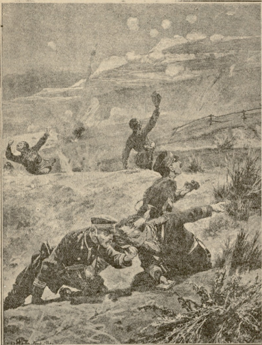
აბონიას ჭარას-კაცები სინჯავენ ბრძოლის ველზე აღებულ ეუმბარის ნატესს, რომ გაავთნ ზარბაზნის სიდაღე.

სარდასაც აღარ ვაწყენებ, დევსრობი მის ნიშნობას და ჯვრის წერას,—დაკინეთ ვადახედა ფასოს, რომელსაც სიამოვნებს