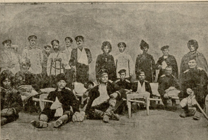
ტურენჩინის პრძილამ დაჭრილი რუსის მღვდელი, ავიფრება და ჯარის-კაცია.

გაკეწაშებული ვარსკვლავი. დაიღ, ეს ვახლდათ ვარდი იგი მშენდა მთელს არე-მარეს სიკაცის მომგვრელს სურნელუბას და ჰაერს ატკობდა. თვალ-გადასვილებელი კაპარა დაფერადებულ ბუნებისა იმის უცხო ატლასის ფერს მოსახამში ჯადო მოსმულის ყმაწვილის ქალის გულ-მეყრდილით ეღვარებდა და ცის ღვთაებრივ დავლურს უფლიდა.