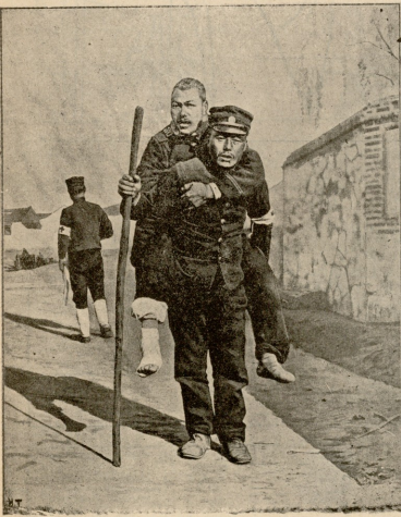
აიზინიას ჯარის-კაცს პრძილის ველიდამ ზურგით კეჭეჭს დაჭრილი რუსის ჯარის-კაცია.

ქალის წინ იღვა ვარდის ახლად გაშლილი მშენიერი კოკორი, იმის ნორსს ფოთოლს ნახებოდა ვაგეო პირის სახე, თითქოს იცინისო, ვით ვაკრიალბუნელს ცის სივრცეში