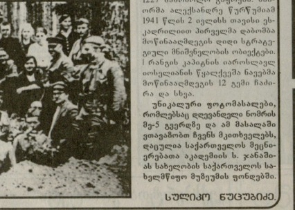
სსსრკ-ის 300-ე მხარეთმცველი პარკიანი, ქალაქ ბრესტისა და პოლონეთის მრავალი საბრძოლო საბაგი მოქალაქე, წყალგაყვანილი, საქართველოს დამსახურებული გენერალ-მაიორი ბაბუნაშვილი ვახუშტი აბოშვილი. მისი ბრძოლის დროს დაზარალებული იქნა მისი მარჯვენა ხელი. მისი მარჯვენა ხელი დაზარალებული იქნა მისი მარჯვენა ხელი.

გაცნობებთ, რომ ა/წ 5 ივნისს, 14 საათზე ჩატარდება სახელმწიფო უშიშროების სამსახურის განცხადების კონკურსი. კონკურსის თემა: "საქართველოს სახელმწიფო უშიშროების სამსახურის განცხადების კონკურსი".