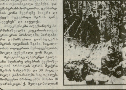
სსსრკ-ის 300-ე მხარეთმცველი პარკიანი, ქალაქ ბრესტისა და პოლონეთის მრავალი საბრძოლო საბაგი მოქალაქე, წყალგაყვანილი, საქართველოს დამსახურებული გენერალ-მაიორი ბაბუნაშვილი ვახუშტი აბოშვილი. მისი ბრძოლის დროს დაზარალებული იქნა მისი მარჯვენა ხელი. მისი მარჯვენა ხელი დაზარალებული იქნა მისი მარჯვენა ხელი.

გაცნობებთ, რომ ა/წ 5 ივნისს, 14 საათზე ჩატარდება სახელმწიფო უშიშროების სამსახურის განცხადების კონკურსი. კონკურსის თემა: "საქართველოს სახელმწიფო უშიშროების სამსახურის განცხადების კონკურსი".