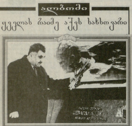
სსსრკ-ის 300-ე მხარეთმცველი პარკიანი, ქალაქ ბრესტისა და პოლონეთის მრავალი საბრძოლო საბაგი მოქალაქე, წყალგაყვანილი, საქართველოს დამსახურებული გენერალ-მაიორი ბაბუნაშვილი ვახუშტი აბოშვილი. მისი ბრძოლის დროს დაზარალებული იქნა მისი მარჯვენა ხელი. მისი მარჯვენა ხელი დაზარალებული იქნა მისი მარჯვენა ხელი.

შეჯასტებენ, რომ სურათების გამოქვეყნება უფასოა. ტელ: 99-66-10.