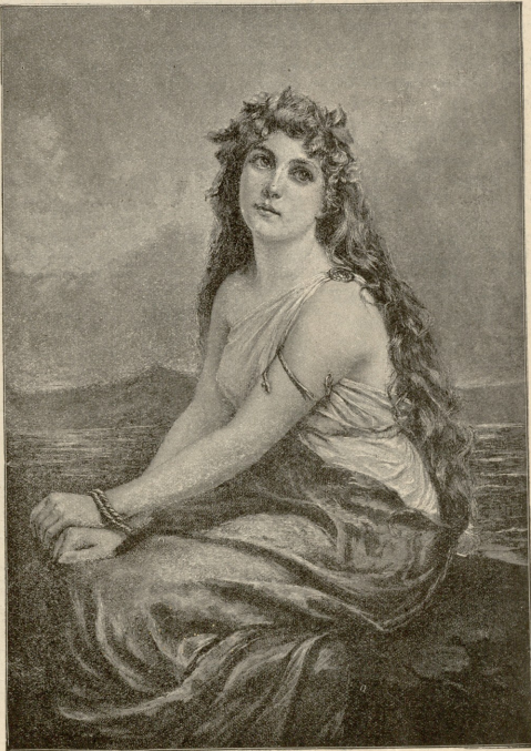
განხორცადლება იქუდა? — სურათი ვინცისი.

გავიდა კიდევ რამდენიმე თვე. ფასო სრულიად მოჯო- ბინდა, ღონეზე მოვიდა და უფრო გულ-მოღვინეთ შეუღდა ოჯახობას, თითქოს მუშაობით უნდოდ შეეცნო ის სულის სიკარილევ, რომელსაც გრწამობდა მუდამ. თუმცა ქმარი ისე