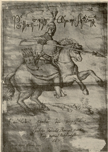
გურაის მთავარი ვასტანგ თავის ძმის პლაქია კათალიკოსის სვედლის შემდეგ 1639 წელს.