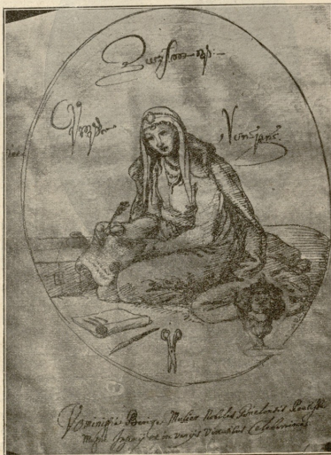
ფომანსია ბერიქ გურული კეთილშობილი პოეტ-ქალი, განთქმული, ღიდად ნიჭური და სათნოებით საცეს.

— ასე მგონებოდა, არ მეი- ყვანდა, მე ათვითან წვედილი, —უთხრა მან ცოლს.