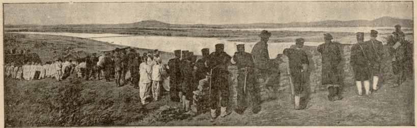
კორეზონდენტები ააღუსთან მომხდარ ბრძოლის უფურებენ.

დამლეც აპრილის თბილ, საამურ სადამოს, შვის ყურებე ოდის წინ გაშლილ ხალიჩზე, იჯდა ფასო და მზიარულად ეთამაშებოდა პაწია ფუნჯულა ბავშვს. ბავშვი ხარხარებდა და უფართხუნებდა მსუქან ხელგებს ლოკებზე. ხან-და-ხან წამოიწყო, აღდგებდა, მოეკიდებოდა კისერზე და უვლიდა ირგვლივ. ფასო კი ვაბრწყინებულს სახით აშველებდა ხელგებს აქეთ-იქიდან, რომ არ დაეცემულიყო ფუნჯული. ხან გამოეც.