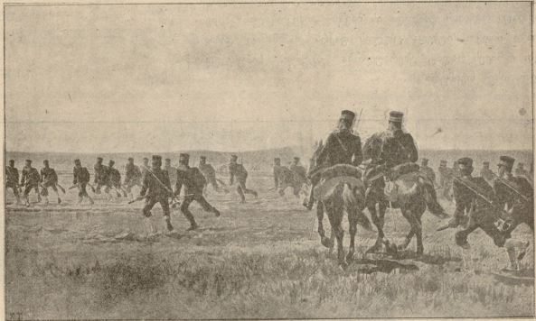
ივანიშა აპოზიანის ვარისა რუსეთის სიამეგრებზე ანდრესან.

— არა, არა, თეიმურაზ, რას ჩივი, რა მომლოაღეს: რვა ვერს რავე ვერ გვეიარ; მარა... — ის ერთ წამს შეჩერდა და ისევ ჩქარა განაგრძო, — მარა გუუშვი ივანიკის ხარები, ამას