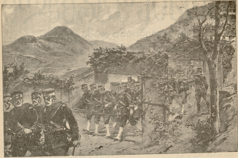
ბაღდადის ვარი რუსების მოსტყევადად სავანებოდ გამართულ შეიგებებში მადის.

ნოდა ბავშვს და, მივიდა თუ არა, მაშინვე იყევანა და აის-როლა ჰაერში.