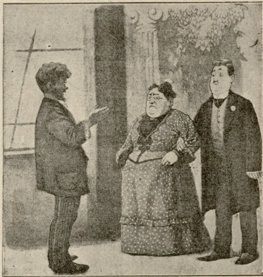
სიდედრა. შიდა, სიძე! სურათა ხელი მოგზაიო და ისე კადავ- ღათ სურათი.

ფოტოგრაფი. არა, ბატონო! კე ბუნების წინააღმდეგი იქნება.