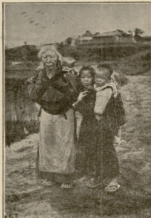
გლეხი ღვავაკიე შეიღებით.

კანონის ძალით დიდი სასჯელი მოგელით, — მიუგო გამომძიე- ბელმა, ჩაჯდა თავის განჯერ საეარქელში, რაღაც უთხრა მწე- რალს და იმანაც ჩასწერა.