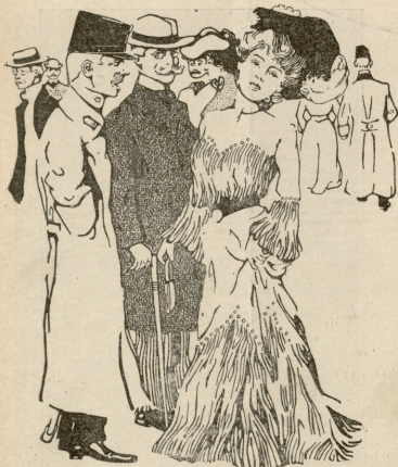
— ქალო, ამ ზაფხულს სიდა მობასწდებით სსაკარავოდ თქვენი აუადმუოფობის მოსარჩენად?