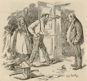
— რა ამავეა? სმურბო მამქსმა წხუხისა, გათმო- ქეცი, რომ ეთქველოთ.