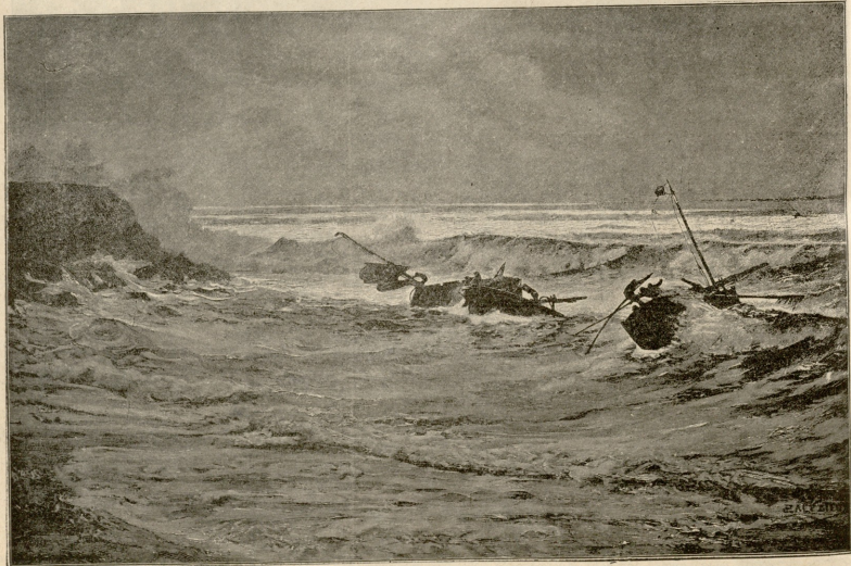
სადგის წყვართებში. — სურათი ზაფხულისა.

ეფროსინეს უთქვამს ვასასისთვის, — განაგრძო კითხვა გამომძიებელმა, — რომ ორსულად ვიყავი, ძროხამ წიხლი მკრა, მუცელი წამიხდა და მკვლარი ბავშვი გვშობე. ახლა ჩქარა ჩემი ქმარი ჩამოვა, არ მინდა, რომ იცოდეს და გეხვეწები, სთქვა, ვიოამ ბავშვი ჩემი ყოფილა. ნაძიძობასაც რამდენსაც იო-