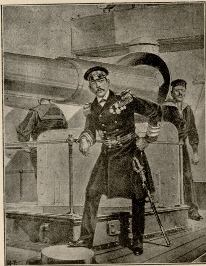
კონტრ-ადმირალი კაბიშუაბ, რომელიც ვლადივოსტოვის ესკადრის დარჯობა.

ლაქის ქუჩაში უპოვნიათ დაგდებული ხალო — შობილი ბავშვი მამრობითის სქესისა, რომელიც პოლიციაში მოუყვანიათ და