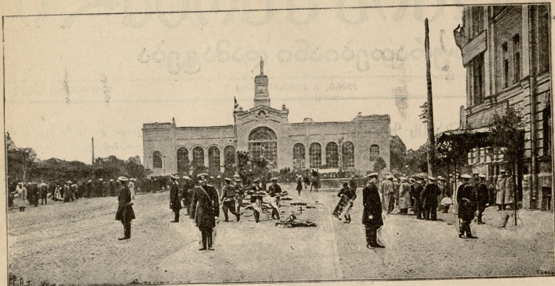
ადგალი, სადაც მოქალკე შანაგან საქმეთა მინისტრი ფინანსდევს.