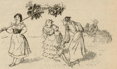
სოფლის ქადა. ასე რა მომწერებან ეს ქადაებს კოაწიება, ნეტა რა უნდა ჩემან? მოდა ერთი თანს ვუხამ და შვეარსკენ ამით კავადრების თვალწინ. ამ ჩემ ფოცხით მოგხსნი შდაბებს და უაღბ თმას...