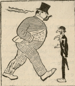
ქოლკების გაქმედავი. ინებუთ, ბატონო, მშვენიერი ქოლკა! სახლ მოდის ხელის მოსაკიდებელი ტრაი ატეს. გაბეღვლი. ჩქარა, ჩქარა მომეცი! არ მტყდა...