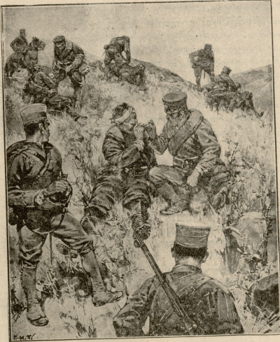
მტრები ბრძოლის შემდეგ. ახმონი და რუსი დაჭრილი ჯარს- კაცები ერთმანეთს უფლან.

— ამას უფურე... აღარ შემიძლია მეტი!... ცოლქმ იმ ჯგოჯებთმა სამსახურმა გამოიძლია სიცოცხლე: გამომატი- და, სისხლი გამოშრა, სიარული მივიძს, დაჯდომა აღარ შე- მიძლია კაცსაკენ, დამაბრია, ორმოცდა ათი წლის კაცი სა- მოცდა ათისას დამმსჯავსა. შინ მოვლად თქვენგან აღარ მაქვს მოსვენება... ქალი, დაბრდი და როგორ ვერ მიხე- დი?... რა საჭიროა ესლა ჩვენი ნუკისთვის ატესტატი? ვერ