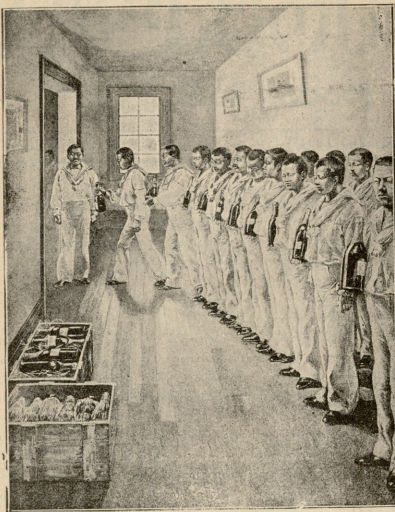
აბაზნელი შებენი უმასხანსდებან უცხოელ კორპორაციონებს.

დღემ გაიღმა, სიამოვნებისაგან სახე გაუბრწყინდა, მაგრამ მალე ისევ დამჯი შეხედულება მიიღო და წარმოსთქვა: — გამაღობთ!