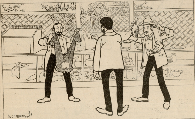
ჩი (11) შინაი, აბ გ.მ.ტ.