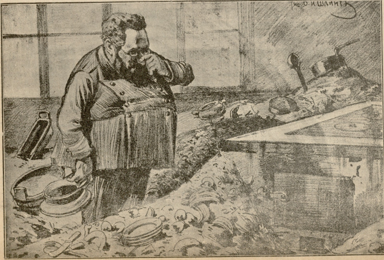
ჩი (11) შინაი, აბ

მეორე სანატრია. ეს ჩუქები? მებუფებტე. ჭო... მან კარტიოდის ვახსავდით.