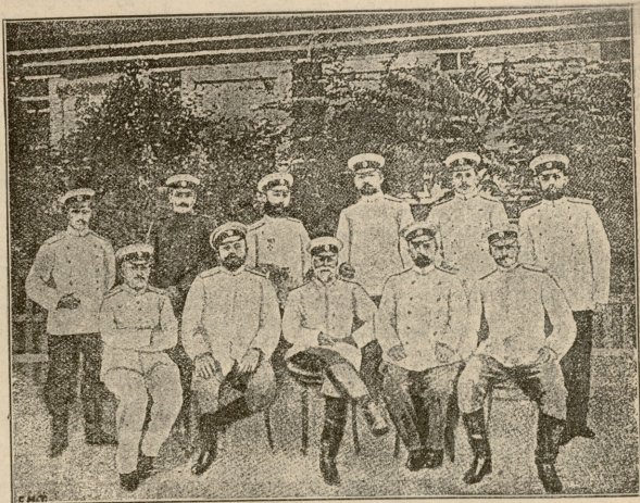
ზირტარტურის დამცვენი. გენერალი სტესესი და იმისი შტაბი.