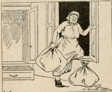
დედაქატე. ერუბა, პატროსინა პატრონია აიანს, უშინდა სიბნათი...