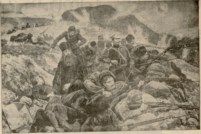
გენერალ შტაგელბერგის ვარის მოწახვე რაზმი იანოხელთა იერაშის იერებს.