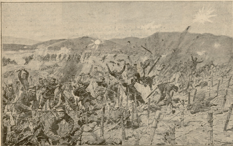
„აპოკალიფსის“ იერონიმო ბორტ-არტურის სიმაგრაგზე.

რა კარგია! რა კარგია! ღმერთო და თვისთვის.