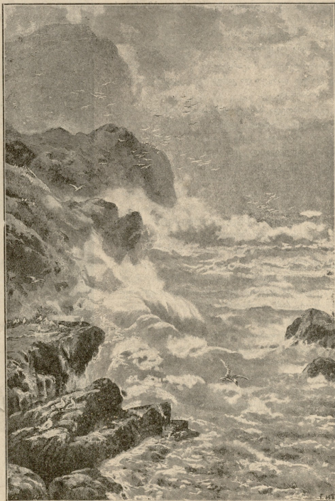
ზღვრე დღღაღეს. — სურათი კინისა.

— რა ცნობა უნდა ჰქონდეს კატორენიოთან?! მე პა-