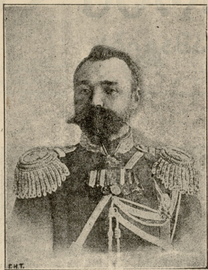
გენერალი გონდრატოვაჩი. პორტარტურის დამცელი.