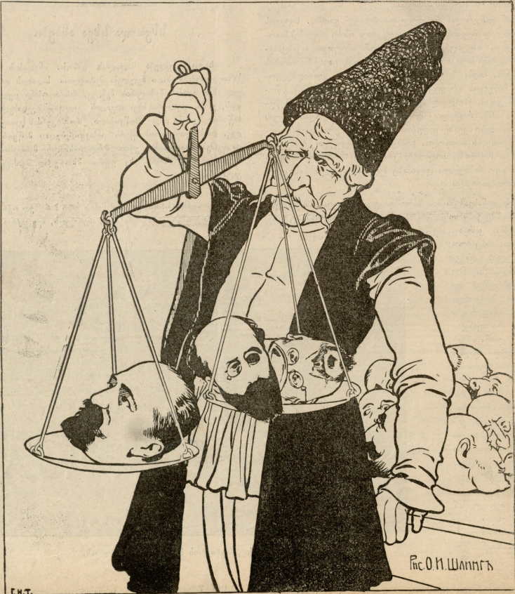
ცელოსნის ძალადის თამის პარპიციის ბაში