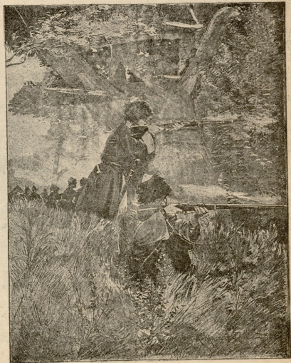
დავესტანის ზოგაის ლეკუბა სროლის დროს.

მაგრამ მალე, დიდდამ იგრძნო სიკვდილის მოახლოება და დანაწილა თავისი ქონება. გვიდა ცოტა ოდენი ხანი და ჩემი დიდდა უცებ გარდაიცვალა. არ მომეძვარა, მხოლოდ მიიძინა. გაუღვიძარის წილით: სადილს შემდეგ დალია თუ არა ყავა, მიწვა ლოგინზე და აღარც ამდგარა. თავის დღეში არ დამავიწყდება ამ წუთს იმისი სახის გამომეტყველება; გულუკეთობის დიმილი პირზე არ მოსცილებია. მე არა ვშორდებოდი, ის იყო ჩემთვის ყველაფერი, იმან პირველად გამაცნო აზნანი, თუმცა თვითონ ცუდად ლაპარაკობდა რუსულად სურდა ჩემთვის ყველაფერი ესწავლებინა და აღტყებაში მოდიოდა, როცა გერმანულად დავიწყე ტიტყვი. ექვსი წლის ვიყავი, როცა დიდდა გარდაიცვალა, და მასთან ერთად დამიარხა ჩემი ახალგაზრდობაც. ვაგზი შეუფერებლად დინჯის ხასიათისა, ბევრში თამაში ან სხვა რაზე ვასართობი ვეღარ მიზიდავდა. სიყვარლის აღერს ვედარსადვე ვერა ვგრძედი, თავს ვანმარტოებულად ვგრძნობდი, სადმე კუნძულში, ბალში მივიმალეობოდი, იქ მთელ დღესა და ღამეს ვიჯექი, ვფიქრობდი და მწაჩედ ვსტიროდი. ხასიათი სრულიად