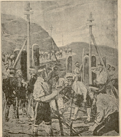
თანხლებია აკოებენ დანგრეულ რეინის გზას

საქმე იქამდის მივიდა, რომ არა მარტო ცხოვრება გახდა შეუძლებელი, ღამის გათევის ნებაც არსად მქონდა. სახლის პატრონს სასტაკად აუკრძალეს ჩემი შენახვა, იქნენ მშობლების ნებადუართავედ არის ზინიდან გასული და, თუ პასპორტი არ ექნება, მშობლებთან უნდა გაიგზავნოსო. ვინ