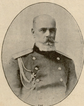
ა ა. ფ რ ი შ ი. ვილნის, კონის და გროდნის გენერალ-ლეიტენანტი ტოპო და ცხილის სამხედრო-ლექსერის უფროსი.

ჩემი დიდდა მეტად გულყეთილი ადამიანი იყო, ერთგვარად უყვარდა თავისი შვილები და ყველა გარშემო მყოფიც, ამიტომ ყველა დედას ეტანა. მშვიდობიანად გაატარა მან თავისი სიცოცხლე და მშვიდობიანად გარდაიცვალა, — დემოთმა სასუფეველი დაუშვიკოროს! მხენ დასახლისი იყო, სახლში უწესობა არ უყვარდა და ყველაფერის თვალ-ყურს ადევნებდა. ავლად იდებოდა ბლომად გეკონდა, მოსამსახურე აუტრიტოლი ვეყავი, მაგრამ მეტიხადღედ ამისა, სანამ დიდდა