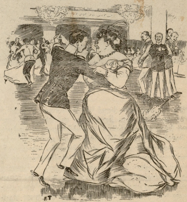
ქალი. რა ნეტარებაა, როცა ასე ნიტიით დაფრინავ დარბაზში.