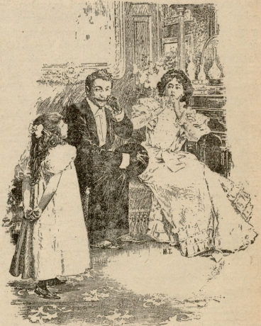
კბე (პატარა ქალს). რაღა ხარ აკეთი უეითელი? ხი დღემუნე უოკლეთის როგორ თეთრითაღად დავის... ქალი. დეღა მე რაღა მამლევს ეფერ-უმარდს.