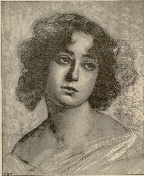
ახალგაზრდა ქალი.—სურ. კოტეფიდიას.

გამომეტყვალა, მუდამ ჩუმიდ და გულწაბეულად ვიყავი. დედას ამიტომ კიდევ უარესად შევძულდი. რა თქმა უნდა, სასმელსაქმელი არ მაკლდა, ტანისაქმელიც მუდამ მქონდა, მაგრამ ყოველივე ეს მხოლოდ საზოგადოების თვალის დასაზაბად.