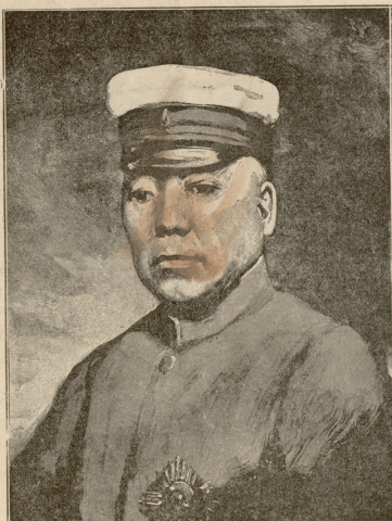
მარშალი ო ა ა მ ა,