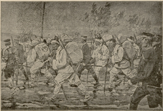
აბოიანის სამხედრო ფოსტა

იკინთე სადაც მიმალულიყო. — აღფერეო გამივიდ შენ... არც ზვეწმა მომეხმარა, არც დაქდებოდა... მეტი გზა აღარ მქონდა... მე მაგას ვერ წაებობოდა... იკინთის ბარბაი... — ათორღლებულის ხმით ეუბნებოდა ფერ-მიხილი ნარო მღვდელს, რომელიც ერთ