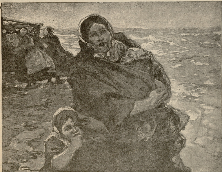
ქალანდელ მყოფსკეთა ცოდუბა ქმრებს მოვლან.—სურ. პარტელისა.

როდესაც წასვლა დავაპირე, მოვიდა. აკრძალული მქონდა ჩემი გაცილება, მაგრამ განა ჩვენ გამოუმშვიდობებლად ერთმანეთს დავშორდებოდით? ნამდვილი სიყვარული ყოველთვის იპონის გზას. მშობლებმა გაგზავნეს ის ქალაქში — რაღაცების სასყიდლად. ის ოჯახი, სადაც იმის მოუხდა გაჩერება, ჩემი ნაცნობი იყო: მე ამ ოჯახში ბავშვი მყავდა ნათლული. ჩვენ აქ უცრად შევხვდით ერთმანეთს და ამ შეხვედრამ კინაღამ სიცოცხლის გამოგვასალმა. ძლივს დავგავშორეს ერთმანეთს. ერთმანეთი ვიყვარს და კი არ ვეკუთვნით ერთმანეთს, იმიტომ რომ მე მოსამსახურე ვარ. — ოჰ, რა ძნე-