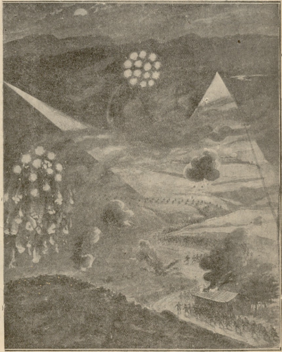
მორტრეტურთან დამე ბრძოლას დროს.

ბოლოს მივადწვიეთ ქ. რ-ს. აფიცებმა დაწვრილებით მიამბო ყოველი ამ ქალაქის შესახებ, სადა რ იყო და და- უშაბათ, თუ ვერ მოაწყო სასქემები, ისევე მე მომმართო. პარ- თლაც ასრულდა ის, რასაც ვიჭრებოდა აფიცერი. მოგზანე ღვიდას სახლი, მაგრამ იქ არ მიმიღეს, რადან თვითონ დეი- და პეტერბურგისკენ გამგზავრებულიყო და იმის მამული გამეც კი მე არ მიცნობდა. ამიტომ მივმართე ისევე იმ აფი- ცერს. მისი ცოლი ძალიან თანაგრძნობით მომივიდა. იმას ჩემ მდგომარეობის შესახებ უკვე ყველაფერი გავყო. მიმიღეს აფი- ცერის ოჯახში, მიიხარეს, ნურასგვრში ნუ მოგვეკრიდები და, სანამ სხვაგან მოწყობოდე, ჩვენთან დაბნაიდო. დავისვენე- მეორე დღე აფიცრმა ბარათი გამაჩანა ერთ ადგილას. რად- გან ამ ქალაქის მცხოვრები ვიყავი, ადვილად შემიქნო მე- შოვნა თავ შესაფარი შრომის მოყვარეობის სახლში. მართლაც დავბინადე იქა. მამლეღანენ სასველ-საქმელს და უკუელორე იმას, რაც აუტოლებელ საჭიროებს შეადგენდა, სამაგნიროლ- ჩემ კისერზე შრომა იყო. დავბინადე თუ არა ამ სახლში, მაშინვე ავად გახვდი და ნოემბრიდან დეკემბრის დამლეღანემ ლოკინიდან არ ავმდგავარ. შობის წინა დღით მოვიდა ჩემ- თან დედა და მიიხარა, ჩემთან პეტერბურგში უნდა წამოვი- დეო. ამან ცუდი შთაბეჭდილება მოახდინა ჩემზე. სახზე გულ- გრილობისა და ცარიელ თავმოყვარეობის მეტს ვერაფერ შეამწვედი ამ დედაცკის. არ მინდოდა წაეყოლოდი, მაგრამ ურნობა ვიღარ ვაფუბედე და წავეყვი.