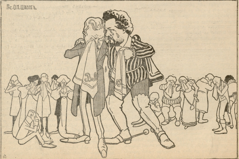
თიბაძეები ტვილიზში. - შილოდე ჭირში არანს შეგობრები.