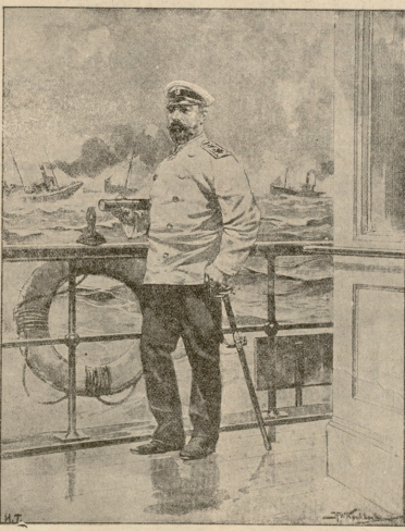
ადმირალა როფესტენსკი, წყარა ოკეანის შიორე ესკადრის უფროსი.

იქვე საჯაროდ ასწორებდნენ ერთმანეთში ძველ ანგარიშებს; ზოგს ფული უსესხნია და სრულიად არ გასწორებია; იმას იმისთვის კამეჩი მიუყვლინია, ისინი ამხანაგად! ყოფილან საქმეში, ის მოხმარებია, იმას კი ფული არ გადაუხდია, სდებდნენ ბრალს, მართალულობენ თავს და თხოვლობენ მაყურებლებისაგან სამართალს; მაგრამ კითხვები კითხვებადა რჩება, ბრალი მართალი, უსამართლობა უსამართლობად. ის იყო გულის მოფხანა, ავიდმყოფის კენესა, უნაყოფო, უთავიბოლო.