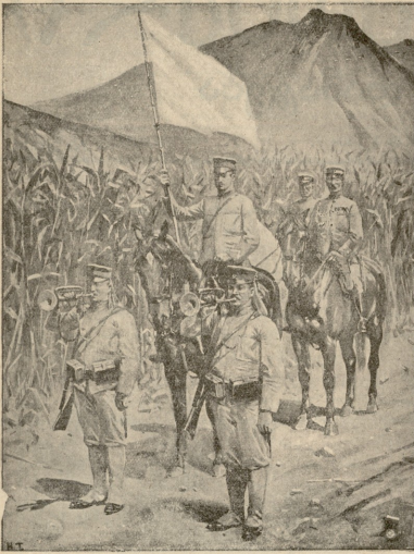
აბხაზე და მდამყურთარი სპარტანურის წინ.

ჩხუბს. მაქსიმე ნელი ნაბიჯით მოაჯირს მიუხალოვდა და აკანკალეზულის ხმით, როცა პატარა ხანს სიჩუმე ჩამოვარდა, იკითხვ: