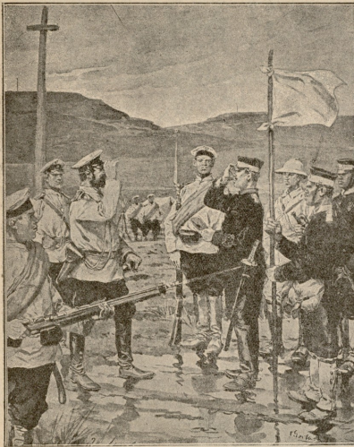
აბონელი ზარდაყვანილი „მარტ-არტურის სიმაგრეზე.“

დი, —ძალიან გულგრილი იყო ეს აღმამიანი. პირში აშკარად ვლანძღავდი, მაგრამ იმის გული არ მოსდიოდა. ბოლოს იმავე სახელში, სადაც ჩვენ ვიდექით, გავიყანი ერთი ოჯახი, ოჯახი მზიარული. მოზრდილი ბავშვები, ახლად მოსული ძმა პეტერბურგიდან. დავიწყეთ ერთად სიარული და საიმოვნებო ღროს გატარება. მოხუცი ბრახდებოდა, მაგრამ მაინც არა სცილობდა ჩემთვის რამე საიმოვნება ეჭვებისა. იმის მიერ ციხეში ჩამწყვდეული ეხლა სამაგიეროს ვუხდიდი. არ ვატყუებდი, თასჯერ მითქამს იმისთვის, მსულხან-მთეჯი. ბოლოს გადაწყვიტე მომესპო იმისთან ყოველივე კავშირი. მე გამიტაცა ერთის ახალგაზდა კაცის სიყვარულში. ეს არც საკვირველი იყო. ადვილი წარმოადგენია, რას ნაწნავს მთელ წელიწადს ერთ ალაცს; ოთხ კედლს შუა ცხოვრება და მერე ცხოვრება ისეთ აღმამთან, როგორიც ის მოხუცი იყო.