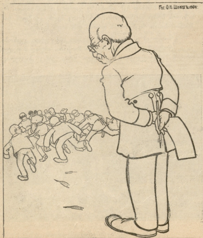
ჩი. ს. ს. ს. ს. ს.

კატა. გაკეცილებ, ქალი! შეყვინა მიწნობთ? ქალი. როგორ არა, კაცნობთ: ამ დღეს სიღა რომ გაკარტოვ- მაგისთვისვე, ის არა ხარ?