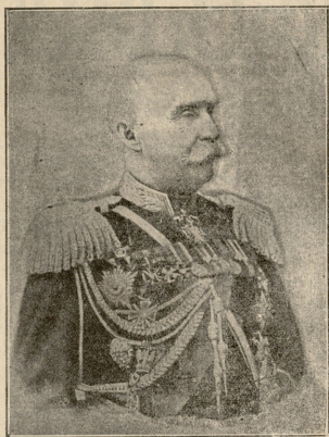
გენერალ ბარანა ბ. გულბასა, მანჯურაის მესამე არმიის უფროსი.

— დღესტორს ჯვარი დევირონ, მე ვეტყვი ხუცესს, — სთქვა მამუკამ, — აბა ყოლიფერი ხაზირათ იყოს სადილიზა! მორბედი ხომ გავზავნეთ აზნაურებთან, მოურავო?