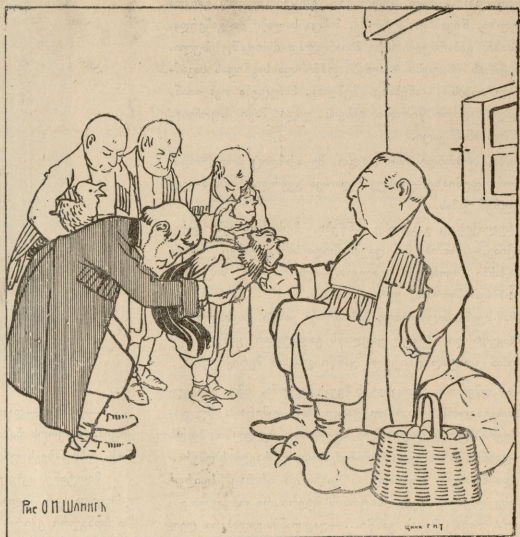
ახლად არჩეულმა სოფლის მამასხლისმა „ჩაბარა სამსხსური!