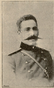
ზარეჩიკი სამსონ ახაბქი, დაჭრიდა ანტონის ბრძალის დროს.

— ვესურს, ოსმან-ბეგო, ვგავგონო ქალების სიმღერა? რეხა არ მითხარი ამღონ ხანს? სტუმრის სურვილი კანონია ჩემდა და შენ ჩემი სტუმარი ხარ. — მა კ ოდნავ გადაიხარა უკან და რალე უთხარა იქვე მდგომ მორბედ-ბიჭს.