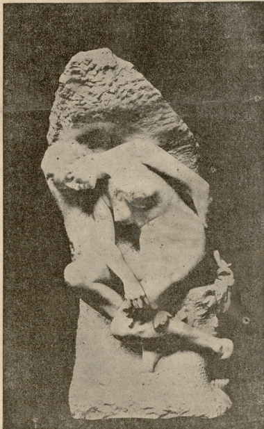
მედა. — ქაჩაქება კობრუსი.

ქალბატონის წინ დამოკლი აღღვებულნი, გაწითლებული დიღვარდისა გაქვევდლიყო სხიარდისა და სირცხლილისაგან. ქალბატონი უღიმიდა მას და უსვენდა თავზე ხელს. ბიჭია კი მორცხვად იარბოდა ბაშინი იმითა და