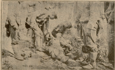
დაჭრილი ამიანიას ჟარის კაცა ამოეეს სუთა დღის შუამდე ტოცხალა.

არ მინდოდა ჩამედიანა ასეთი საქმე, მე არავისთვის ცული არა მსურდა, როცა საომარად მოვდიობდი. მე სრულადაც არა ვფიქრობდი იმაზედ, რომ მოამბედებოდა ვისმეს მოკვლა.