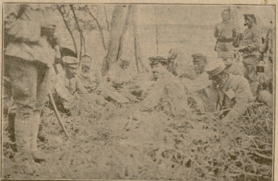
ამიანიას ჟარის კაცთა სადილობა.

მივფოფავ, ფეხებს მივართავ. დასუსტებული ხელები ძლიერ სძრავენ დამძიმებულს სხეულს. გასავლელი მაქვს ორი საყერი,