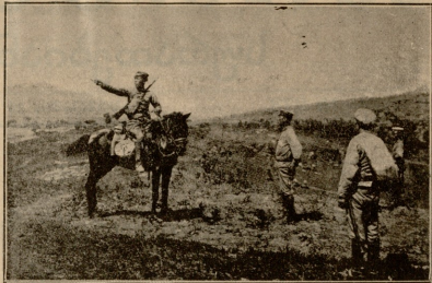
კენერაღი ხსენება პრმოფის ველზე.

პირაღმა დავეცი. ამიტომ ეხედ ამ ვარსკვლავებს.