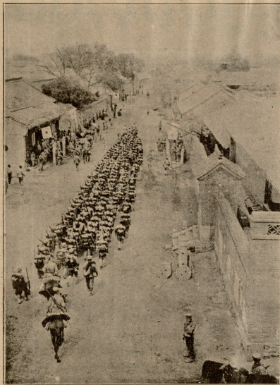
ამიანიას ჟარის შესვლა ღამათაში.

მხოლოდ იმას ვფიქრობდი, როგორ დავუხვედრებდი ტყვიას ჩემს მკერდს.