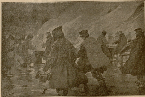
სამხარეული აბონთდა ხსენება.

ეს ამბავი რახანია მხოვად, მაგრამ ყველაფერმა, მთელმა ჩემმა ცხოვრებამ, იმ ცხოვრებამ, როდესაც აქ არ ვიწვიქი