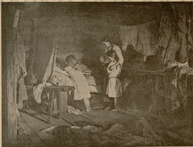
შიამაყვადები დედა. — სურათი ლემინასი.

— არა, ნათლი, გენაცვა, გონია ოფლი მოღისი სახნი გადახდა არ შეიძლება! — მართამ, რომ ოფლი უფრო კარგა მოსწილიდა, იქვე ლოგინზე მივდებული ხილანანი ბავშვს შუბლზე წამოაფარა.