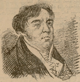
ი. ბ. კრავაჯია.

ნოემბერში სწორედ სამივე წლიწინ უსრულდა (დაიბადა 1768 წ., გარდაიცვალა 1844 წ. 9 ნოემბერს), რაც რუსის გამოჩენილი მწიგნობარე კრილივე გარდაიცვალა. ლეს კრილივის არაკლებად მთელი რუსეთის ასლდაცნობა იხრდება. ჩვენში რუსის არც ერთ მწიგნობარს არ იცნობენ ისე კარგად, როგორც კრილივის. იმის არაკლებად თუ ხელ არა, დღე ნაწილი მაინც გრძლიანარცნობილია, ამისთან ისეთ დიდ ნიჭიერ პოეტის მიერ, რომ გორნიც აიან აკვი და რაგიელ ერისთავი.