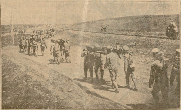
აიხილები სავადაგებენ თავიანი შოკულად ამხანაგებს.

ყველა უთავებლოდ დაბრბოდა, კიეინობდა; დაფატრობდა და შემწეობას ვერ უჩინდა.