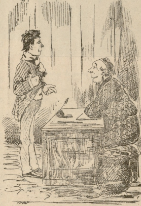
— გადასწერეთ ჩემი ხელნაწერი? — დიალ. — რიგვარ მოგვეწონათ? — უკატრავად, არ წამოკითხავს.

მაგრამ ვერ ბედავენ, რაღვან შესაფერი ტანისამოსი არა აქვთ. ხანუშამ თავის ქალები ქვეითა სართულში გადმოიყვანა, რაღვან იქ ხალხი უფრო მეტად ხვდება და ხალაც დიდია. შუა ღამისას პაპაშა და ქიაყელა შინ მოდიან, ორივენი ერთ ქეხაზევებიან ტ ხშირად მთელ საათობით ისევ თავიანთ გვირგვინებსა, ქუცებსა და წიწილებზე ლაპარაკობენ. შურიით იგონებენ თავიანთ ბრწყინვალე წარსულს, ოხრავენ, ერთმანეთს ამტკუნებენ, მაგრამ თავიანთ ლაპარაკს როლოს მაინც ისევ გვირგვინთა ტ წიწილებით ათავებენ... მ. ალაშაშვილი.