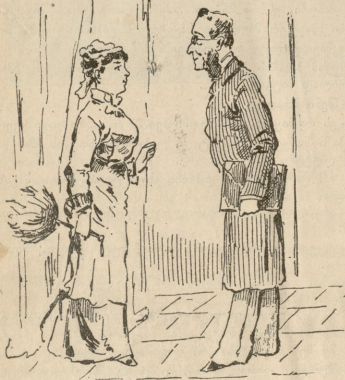
— ქალბატონი „ბოდიშს იხდის, ვერ მივიღებთ“, რაღვან ტანთ იცვას. — საეკირველია, ყოველთვის რამე მიხვია: ხანჯიკვასში, ხან იხდის... მამო რილის შეიძლება ნახვა? — ან ერთხან და ან მეორის შემდეგ.

ძინებში გამოხვეული პაპაშა საღამოსის ბაზარში დაბუნდებულს, კარგად რომ შემოღამებდა, ქიაყელას პოულობს და თავის ქუცებსა და წიწილებთან მიდის. ქიაყელა სისხლს აყოლებს ნახველს და ყოველდღე სიკვლის ელის, მაგრამ პაპაშას მაინც არ შორდება და ორივენი ბინდიდან შუაღამემდის ხანუშას სახლის წინ დადიან, ხალაში იცქირებან, გვირგვინზე და წიწილებზე მსჯელობენ და ხალაში შესვლის ნატრობენ,