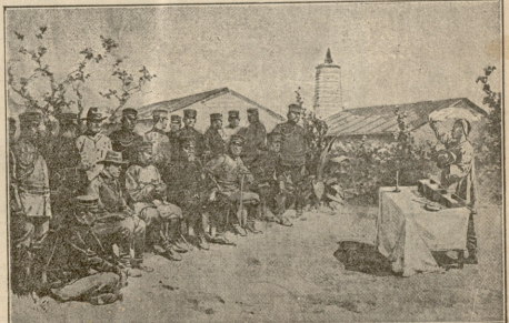
მარშალი ითამა და იმისა შტაბი ვაფორის წარმოდგენას დაითამაშა, ტენ. კურაპატკინისკუელ ააღმა.

პაპაშა გაჩუმდა. ჯერ ერთ წუთს თითს უწინვედა და პირდაპირ თვალმშუი უსურებდა, მერე კი დაბაღის ხმით უთხრა: