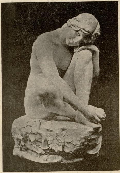
ევა შეტოლებამდე. — ქანდაკება შერსისა.

მოვშორდი ნაცნობს, შეგობარს, ნათესავს, მოვშორდი სამაშობლოს, საყვარელ ცას იტალიისას და ვიცისრე ვლჩად აქ წამოსვლა... რა ბედნიერი ვიყავ, რომ გხვდებოდი ვერცდ ბედნიერს!..