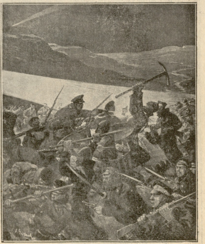
დამე თავდასხმა აბასელეებზე

მარუჩა (დასახავს ისმაილ ბეგს გაკვირვებულა) ისმაილბეგ! შპი. აჰ! ისმაილ ბეგ! ვი შენი ბრალი! დაგიკირეს! ესლა ე ვერსად ვამხავო! რა უყავ დედოფალი! სთქვი ძალი, ჯალათი გმის!