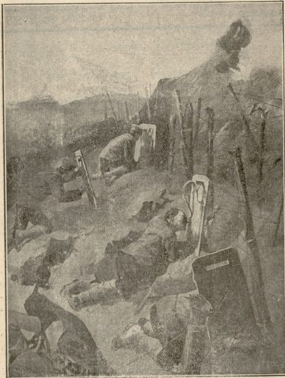
აბანოვლები ფარებს საშუალებით ანადგურებენ მათთვის დამბეჭდვას.

შაპი. ხა! ხა! ხა! იქნება სტუმბოდეს! მაშ სთქვი ვინ გამოგზავნა, ვინ დაგარია და სიკვდილიდან გავანთავისუფლებ.