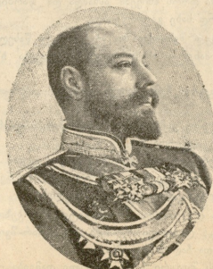
შეტერაურგის გენერალ-გუბერნატორი ტრეპოვი.