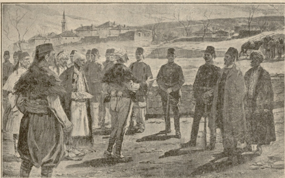
საერთაშორისო კომისია, რომელმაც უნდა მოსაღმოსო რევიორშემა შეკედინაშა.

უკლებ დედის საშინაობა ფიქრმა გაურბინა თავში: ვინ თუ მეწვირომანის სიტყვა გამართლდეს: განკარგულენა გა- მოიცივლა და ჯარი ღირა მოდიდა ბელეგშიო. ერთის წუთით დალონდა დედის გული, მაგრამ ძალა დატანა თავის თავს და უსიამოვნო ახრი მოიშორა. ორ სათხე მიაღწია ტყეს. ფიჭვის ქვეშ თბელ ჩრდილში მოსჩანდა მინდვრის წვრილი მარწყვი, მწყე-