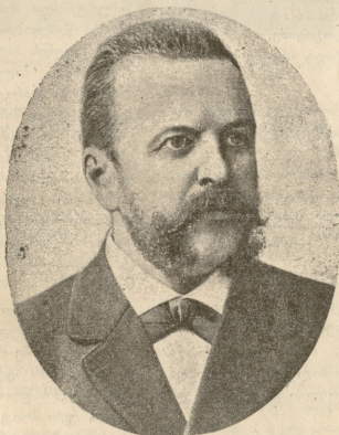
შინაგან საქეთას ძალი მინსტრა ა. ბულიგინი.

სამხედრო უფროსის განკარ- გულებით დიდი ალღუშის შემდეგ ჯარი ბელაში უნდა დაბანაკებული- ყო დასასვენებლად და სპოზას აქ შეეძლო ენახა თავისი საყვარელი ბიჭიკო, ლურჯ-თვლებიანი დანი- ელი, რომელიც ჯარში გაყვანის შემდეგ აღარ უნახავს. წლი-ნახევრის განმავლობაში მხოლოდ ორი პაწია ქუჭკიანი ქაღალდის ნაწეწი მოუვიდა დედას თავის წერილსაგან. სათაოვდა, წერილი მომწერე ხოლმეო, ეს იყო და ეს, სხვა არა იცოდა რა დედამ შვილის შესახებ.