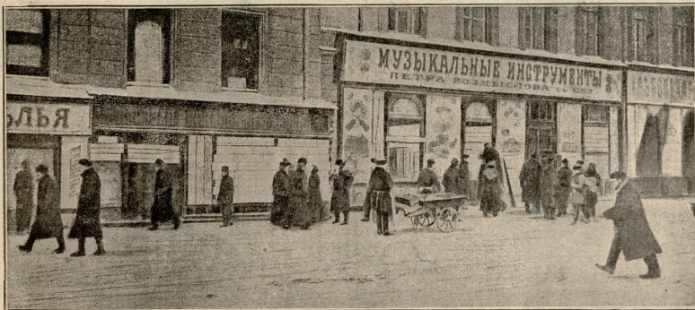
სადგოვია ქუჩა. აფიგურული მალაზიები.

ირველივე ყველანი იცინოდნენ. მოხუცმა გაიღიმა. — მოიბინეთ, ქუჩაში ყველა გაბეთისა და ტურნალის