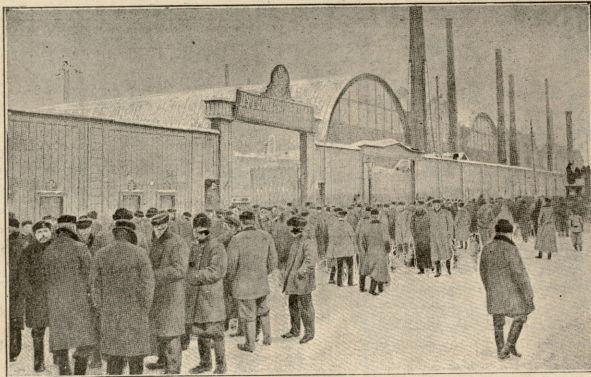
შუტლიფის ქარხნის მუშები.

ბოლოს ერთ მარბილს მოკრა თვალი, რომელზედაც წითლად შედგბილი პატარა ფიცარი იყო მიკრული წარწე- რით, „თავისუფალია!“ გაოცებული ამ ახალ ამბით, იგან ივანისი ჩაჯდა მარბილში და მეეტლეს უაუგის დაუყვირა.