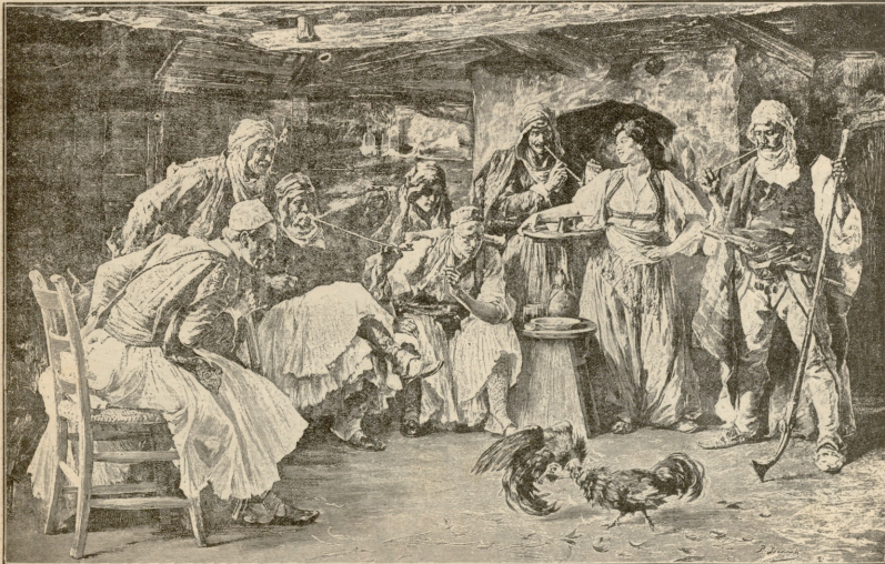
მამლების ძიძგილაობა. —სურათი ივანოვიანისა.

ახალწელიწადი გათენდება თუ არა, ერთმანეთის ნახვასა და მოკათხვას იწყებენ. ჯერ ცოლქმარი ერთი მეორეს დაღხნას უღოცნებენ ახალწლის გათენებას, ეოგელს სიკეთეს და ბედნიერებას დაეწერიან, და დიღს ამით ერთმანეთს სასწუქარს აძლევენ სიყვარულის განსამტკიცებლად. შემდეგ საუკეთესო ტანისამოსმა გამოეწეობან ად კაქმარებთან. ავიანთ უფროსებან მისკათხვას; ნახუ-