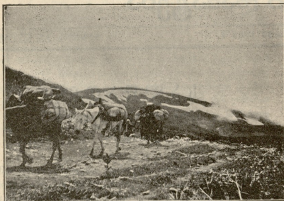
ბახმარო. — ჩაღვადრები.