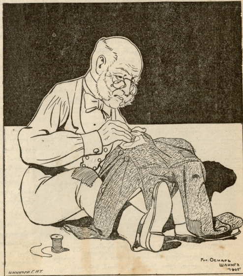
„მუღის თავზე სახარების კითხვა“.