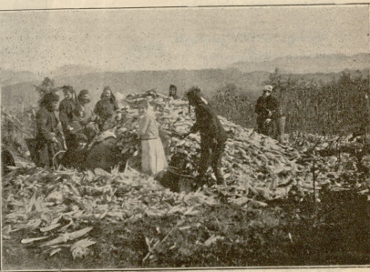
ნავამარი. — სიმინდის ქურჩანა.

„ღუშუ“. კაციმ ველარ მოასწრო მოტრილემბა, რაღაც ცხელი