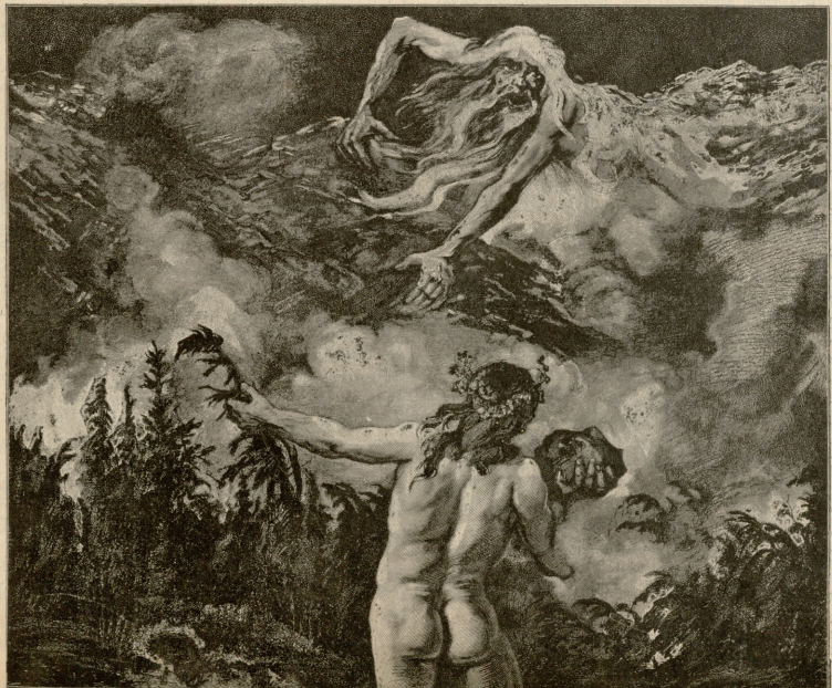
ბრძოლა გაზაფხულისა ზამთართან. — სურათი მიქაელისა.