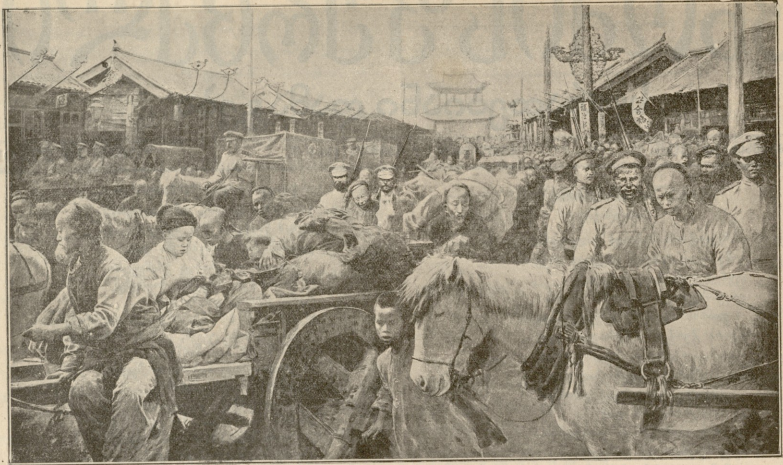
ქუჩის მუყავენი რუსის ვარის წახედის დღე.