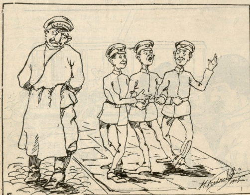
შეგოვე. კეე. წინანდელი დრო უნდა იყოს რომ მალე დაკარგოთ!

შეგნიერ გუნებაზე ვიყავი და... სულ წამწარადა.