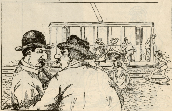
—სავერეგლია, რად უკვას ჩემ ტრამაის ვაგონში ხალხს უპებელად თქიდან ჩა- ჯლომა, საითაც ვახათ გადებული —ამიტომ რომ ვერ ისევე ვახს რეკობენ უთფინს.