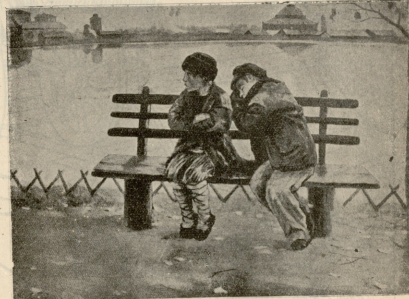
უბნაო ობლები.—სურათი მ. შესტოინანისა.

— საუბედუროდ, არა მაქვს... — რას ამბობ, ბინა როგორ არა გაქვს? ხომ არა ხუმ-რობთ?