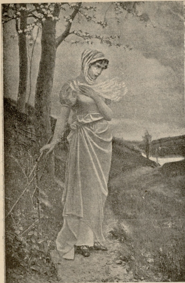
გაზაფხულის ფიქრები.—სურ. ფან ბოლქვაძე-უკუჩხისა.

თან-გენილმა ჩაიხედა ეხლა მეორე განყოფილებაში. აქ კი არაფერი იყო: არც საღარბაზო ზარათი, არც წერილები, არც ფორტაგრაფიული სურათი, ერთის სიტყვით, საფულეში არაფერი აღმოჩნდა ისეთი, რითაც პატრონის ვინაობა შეეძლო გამოეკვლია. თანმა საფულე დახურა. „ეგა, რა მეწყინა!—წილაპარაკე თავისთვის.—ესღა მაკლდა! ეხლა დეტი და ვეიე პოლიციის ბოჭაული! აუტყენი, საღ ნახე, ვის დეკარგა და სხვა, მე-კი უნისოდაც ძალზე დავიღალე... დღევანდელი დღე სულ უზე-ღურად დავებტემა“.