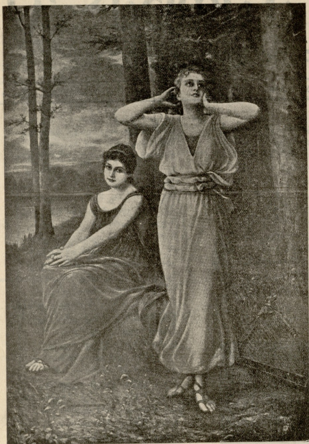
გაზაფხულის მოლოდინში. —სურ. ფინ-აოლენკაუჩენისა.