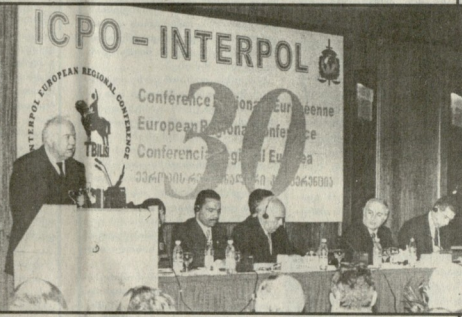
ინტერპოლის 30-ე ყველაზე დიდი...