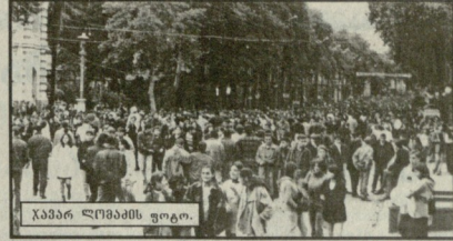
ხაბარ ლომასი ფოტო.