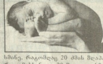
მარკოლო 20 მისი შვილი...