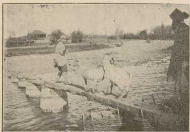
თხების გაყვანა სოფლის ბოვარზე.