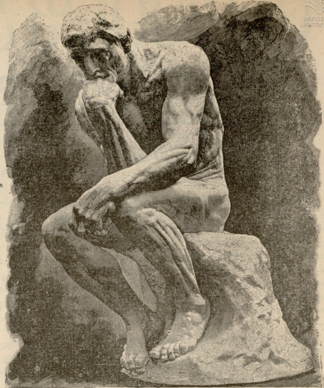
მოაზრე.— ქანდაკება როდენისა.