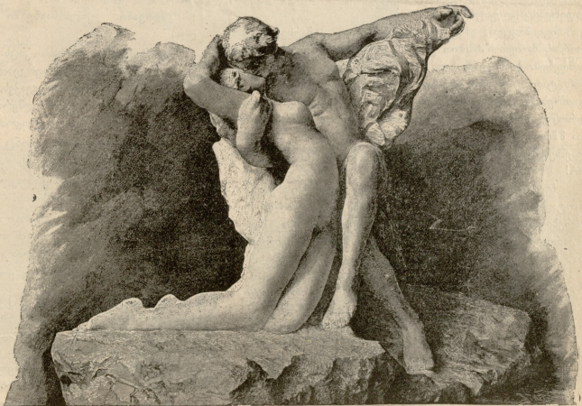
კონა. — ქანდაკება რუჟენისა.