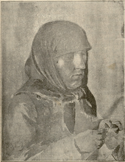
ქართველი მოხუცი დედაკაცი.—ნახტი ა. ბურაძის.

გახარებულად ადამი თავაღმუნებული იდგა. — შენთვის,—განაგრძობდა უფალი,—იმიტომ, რომ შენ მიყვარხარ. ეხლა კი უყარადღებით მომისმინე, რაც გითხრა. გაჭმედ ირველიც,—და ღმერთმა ბაღის ხეებზედ მიუთითა:— „ყოველ ხის ნაყოფის ქვა შეგიძლია, მხოლოდ ნაყოფი იმ