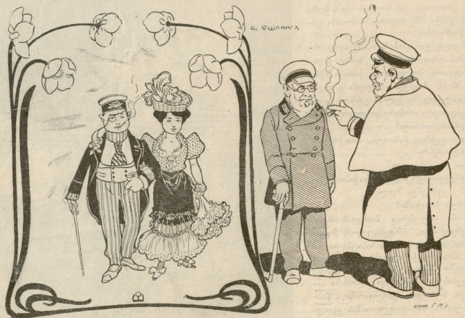
გიშნაზის მოწაფენი, რომელთაც გიშნაზის გარედ, თანხმად მზრუნველის ნებართვისა, შე- უღლიან იარან სხვა ტანიაშისით.