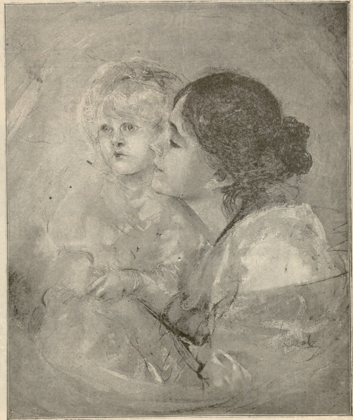
მოსიყვარული დედა. — სურთა ღებნახის.

ბებრმა მოტვლებილი თავი ხალათის საყველოში ჩაწყო. კიხლიარი ვარნაკს მიუხტა.