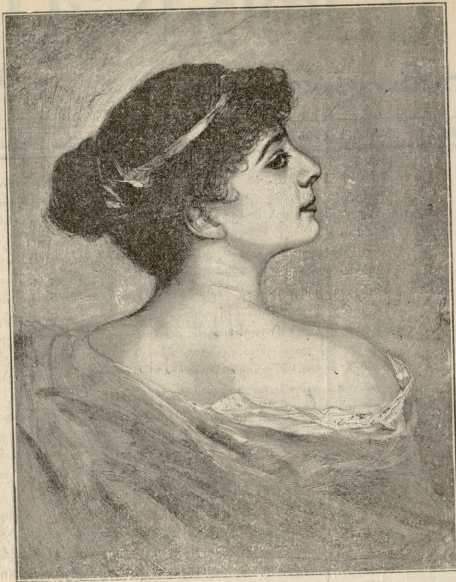
პორტრეტი. — სურათი ლენინასისა.

გაჰყვა. მათი მატუნავი, მიხიჯი ჩრდილები ერთი-მეორეს მისდევდა, იატაკზე და კედლებზე ტოკავდა.