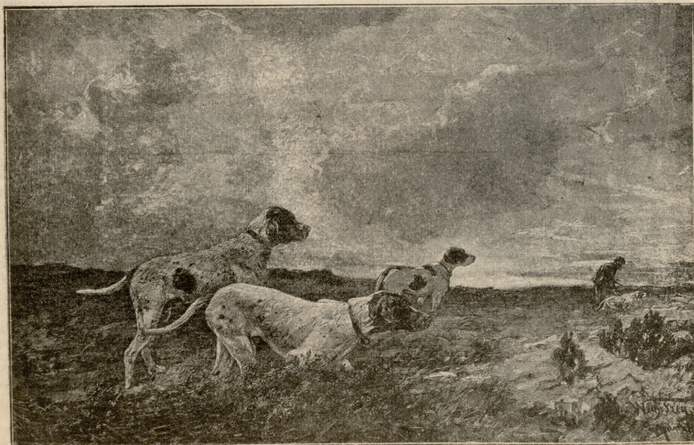
სანადიროთ მიმავლნი.—სურათი გრუკისა.