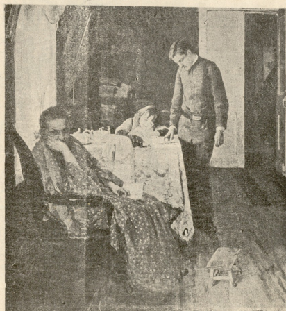
კიდევ ჩავიჭირე. — სურათა კარანასა.

უკანასკნელ ამბებში ბატონი ძალიან შეშინებულიყო, ჰხედავდა, რომ აღმართი დათავქვეებულიყო და ვაჟს უსწო-რდებოდა.