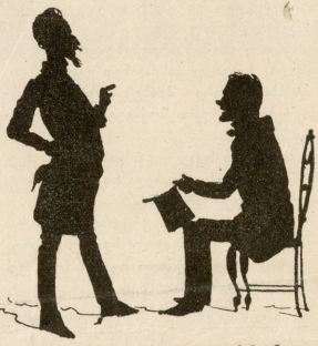
— სკვარეულაა, ის ყვავილია, ჩემი ნუგა გონებიდან; დარ მშორდება, შერად გაიდა ფესვები ჩემს თავში.