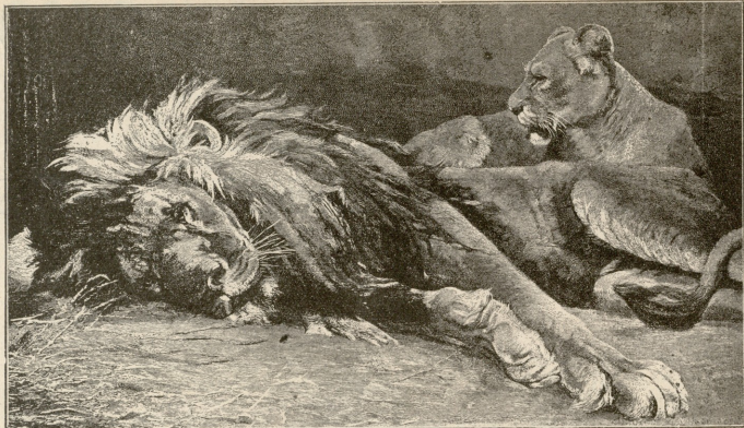
ლომების განცხრომა. — სურათი კელეშპერკისა.

— რა უნდა ჰქნას კაცმა, ამბობენ ისინი, ჩვენ მხოლოდ მაშინ გვიტოვებენ საჭის გარემოებას, როცა ყოველივე გათავებულია, ჩვენების ჩამორთმევას არ ვერწყობით და აბა რაღა უნდა გავარიგოთ. ჩვენ იმ ექიმსა ვგვევარა, რომელსაც მაშინ ეძახიან აედემყოფიან, როცა ამ უკანასკნელს ერთი ფეხი სამარეში უღვას. აბა რაღა უნდა ვუშველოთ მაშინ საჭმეს, რილას მაქნისნი ვირთ! ტანჯვია ჩვენი ხელობა, სხვა არაფერი!