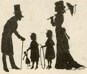
— სკვარეულია, როგორა ჰგვანან თქვენი უმა- წვილები თქვენს მუღლეს. ზედ გამოჭრილი შამა... — ვითომ?... ჩემთვისაც სკვარეულია ეს.