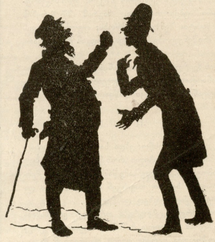
— აგრე არ იქნება, თქვენ რთვინზე საუფუდიანად დამამკიტეთ, რომ... — ინტეუა...