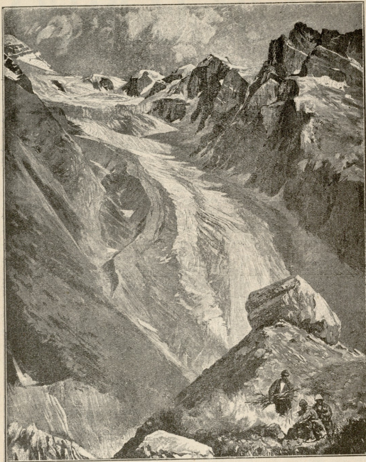
ნაგების მცინვარი ხვანეთში. — სურათი ზღაგისა.

ხლა რაღა გააკეთოს? პირველმა სიხარულმა გაიარა და ჰიორი დარწმუნდა, რომ ჯერ არაფერი გაუკეთებია. სულ არ იცოდა ან საუნჯე სად იყო, თუ კი მართლა არსებობდა, ან რა გზით უნდა მოიპოვო, ან საით იყო გზა. ჯერ მთის წვერზედ უნდა ასულიყო. მაგრამ მთა ციკაბო კლდეს წარმოადგენდა და, თითქო საიდუმლოაო, არც მწვერვალის სწანდა და არც ბილიკი. მართალია, ზოგიერთი გლეხი თურმე ხანდახან ბედავდა და იქ ზალახს გლეჯდა, მაგრამ გლეხები არავის უშვებდნენ ძალა-დაუტანებლად. ჰიორის მარტო ამ საიდუმლოში ხალხისაგან შეეძლო საპირო ცნობების გაგება.