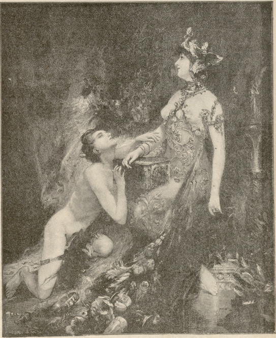
თავანახავეში კერპი.—სურათი დარტიკოსი.

მე რკინებით იყო ამოხლართული. ვეგონის კარებში ხიშტებ ამოწვდილი სლა-დაებით იდგნენ. ფანჯარაზედ შიგნიდან მომდგარიცენ პატრონარი, რომელთაც, ვინ იცის, რა სასჯელი ჰქონდით გადაწ-ვეტილი! მათში რამდენიმე ქალიც ვერა. ზოგს ხელსახოცი თავი წაიერა და სახე დასიგებოდა ტირილისაგან, ზოგი წიწილ-სავით აბუზულიყო, მიმჯღარიყო კუთხე-ში და ვინც ხმას ვასცემდა, ლანძღვით იკოლმბდა. ბევრი სანთელივით გაყუთი-ლებულიყო. რამდენიმეს მიკვლავების ფერი ელო, ივიკრებდით: ეს საღლა მი-ჰავთ, პირველ სადგურამდისაც ვერ ჩა-ღვევსო. ერთნენ ისეთებიც, რომელთაც არავითარი დარდი და ტანჯვა არ ეტ-