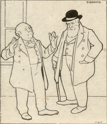
— თქვენც ხომ სახელმწიფო სათათბიროში აჩრევისათვის არ გინდათ ეს სახლი? ვერა, ვერ მოგაქირავებთ! რომ არ აგირჩიონთ, ქირა საიდან უნდა მძლიოთ?