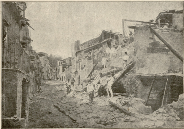
მიწის-ძვრა კალაბრიაში. ჯარის კაცები ეძებენ ნანგრევებში მოყოლილ ხალხს.