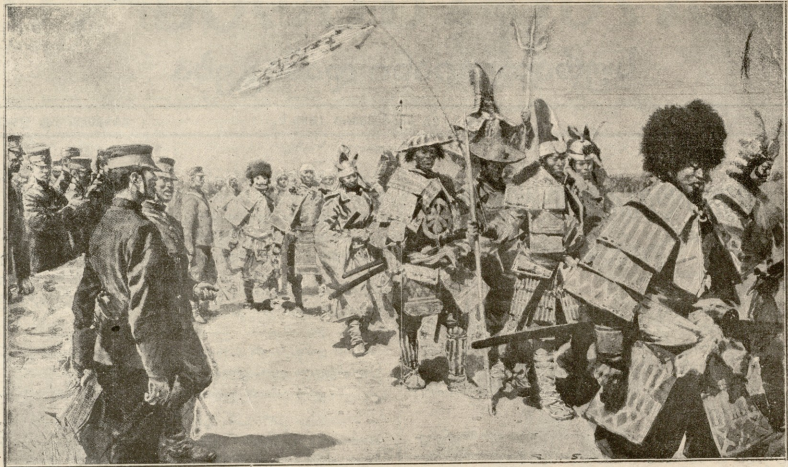
გამარჯვების დღესასწაული იაპონიაში. ვარის-კატე სამურაების (ძველად რაინდები) სხვა-და-სხვა ტანისმოსო აცვიათ.

მიუხაზოდნენ.—ღელა, არ შეგეშინდეს, ჩენა ვართ!—მიე- ხმაურანენ.