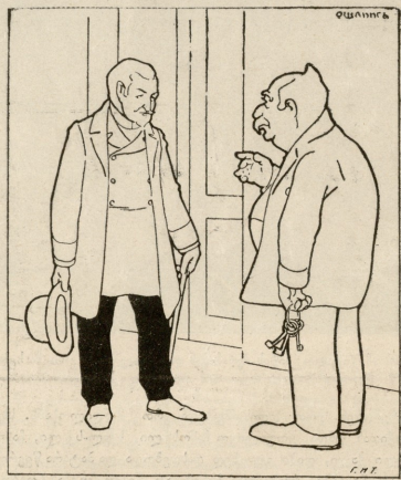
— თქვენს სახლს ვიჭირავებ, მოგცემთ იმას, რასაც თხოვლობთ. მივლედ პარომაში უნდა ჩაწერათ მტერი, რომ სახელმწიფო სათათბიროში აჩრევის ხმა შემოქნდეს.