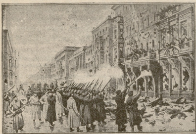
ფილიპოვის ქარხნის ვარები უშენენ თოფებს.