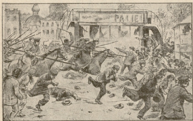
უჩახები სდვენან ხალხს.

კოლადი ქნილდება, საერთოდ, მაგრამ ტანით მალაღია, არა ნაკლები 30 მეტრისა.