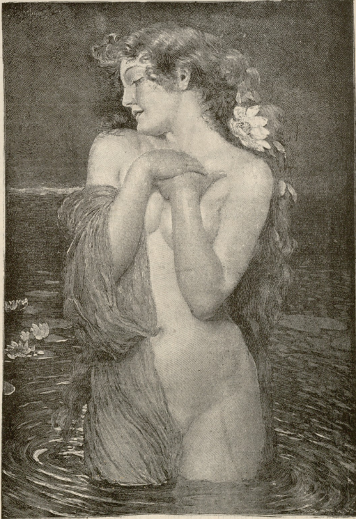
ზღვის ვარდი.—სურ. შუგელისა.

არ შევეუდგებო ჩვენი წრის ცხოვრების აღწერას. აფიკრთა ცხოვრება კარგად, სინამდელით აქვს დასურათებული „პოედილოკა“. ში რუს მწერალს კუპრინს. ამ წიგნის გამო პეტერბურგის აფიკრთა მოწინავე გჯუფმა აღრესი მიართვა