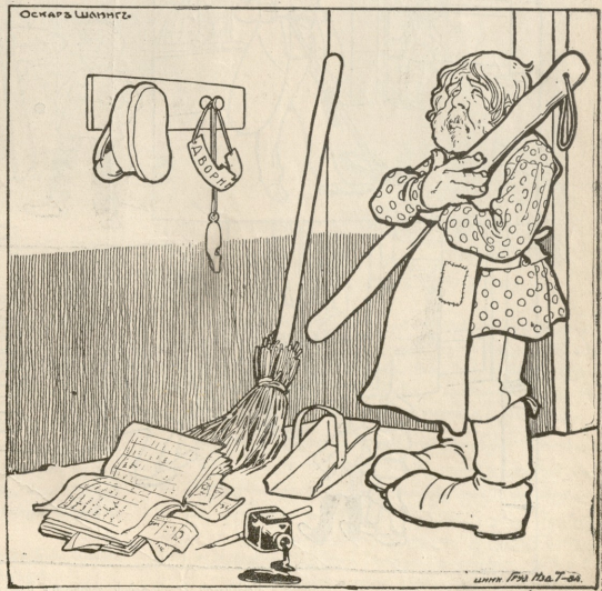
მკეზაგე.—მშვიდობა ჩემო კეტო, ჩემო ტოტო და ჩემო უფლებავ!

მიპირებენ, რა დანაშაული მიმი- ძღვის? უფროსი შევიდა ჩემს მდგო- მარეობაში და იმავე დღეს გავგზავ- ნა დაქვე. გავიდა ოთხი დღე და იმის მაგიერ, რომ დღემთივე გვე- ცათ პასუხი, ქაღალდი გამოგზავნეს. ქაღალდში ეწერა: „გაცნობებთ რომ აფიცრის დანაშაული არ დამტკიცდა და საქმე მოსპობილ იქნა, სრუ- ლიად განთავისუფლების შესახებ განკარგულება მეორე შტაბში გავ- გზავნეთო.“ როგორ მოგწონთ? მე იქ ვიჯექი უმიზეზოდ, ხოლო ჩემი განთავისუფლების შესახებ განკარ- გულება მეორე ალაგას გავგზავნა. ამ რიგად მეორე შტაბიდან ქაღალ- დი პოლკში უნდა წასულიყო, მეორე პოლკს უნდა ეცნობებინა იმ ციხის უფროსისათვის, სადაც მე ვიჯექი და ასე კიდევ უნდა დაგრჩენილიყავი ტუსალიდ. ბოლოს გამამთავისუფლეს, მაგრამ 60 დღე სატუსალოში გატა- რებული, აღმოუჩენგრელი დარჩება ჩემ ცხოვრებაში. ამ სამოცმა დღემ სახსებით გამიზილა ჭრვალები. შეგ- დამა აფიკო გამომცხადეს და მორ-