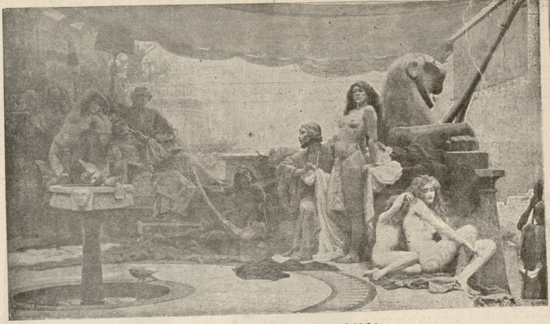
ბაზარი ტყვეების გასასყიდად — სურ. ნოსმანას.

ლიოდა, ვრწუნდებოდი, რომ ჩემი იმ წრეში დარჩენა აღარ შეიძლებოდა.