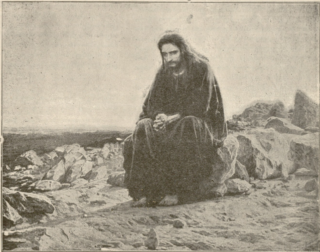
ქრისტე უდაბნოში. — სურ. კრამსკაის.

მთელს თქვენს სიკოცხელში მისს შრომას ითვისებდით, მიგქონდათ მისი უკანასკნელი ლეკმა, მიგქონდათ სრულიად ადგილად, მზალოდ, არ გესმოდათ, რა მიგქონდათ, სცხოვრობდით, უზარაკრთებულაკი არ გეკითხავთ თქვენი თავისთვის, რითი, ვისი ძალითა და შრომით ცხოვრობდით. თქვე თქვენის მოკახულობით აბრაზებდით შვიერსა და დაჯეს ხალხს, როცა