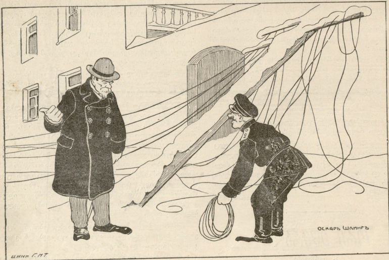
— ჩემო ძმაო, მეორე ქუჩაშია დაშკებულა ძველი ბოძი, სხამა ქვე არაეინ მოიფილოს!.. — ეჰ, ხელა ისეთი დროა, რომ ვუვლა ძველი ბოძები უნდა წაიჭნეს!..